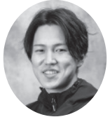
5142 常住 蓮